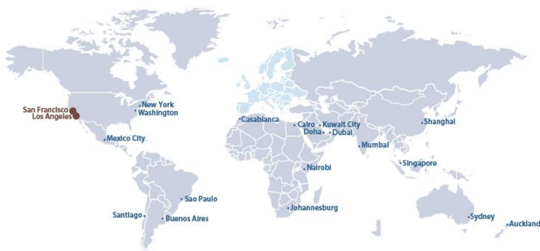
Figura 1: Ciudades incluidas en el GTCI de este año

Nota: Las ciudades resaltadas son aquellas que están entre las 10 mejores del GTCI de este año.